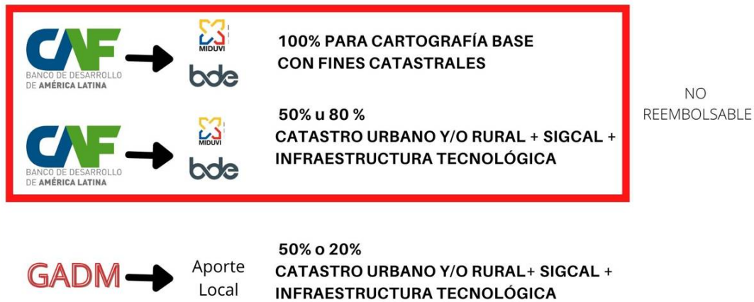
Figura 2: Aporte Estatal y local