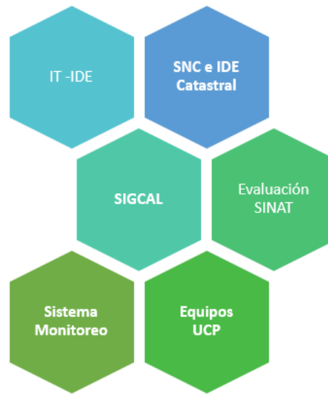
Figura 5: Componente tecnológico del proyecto del SNC