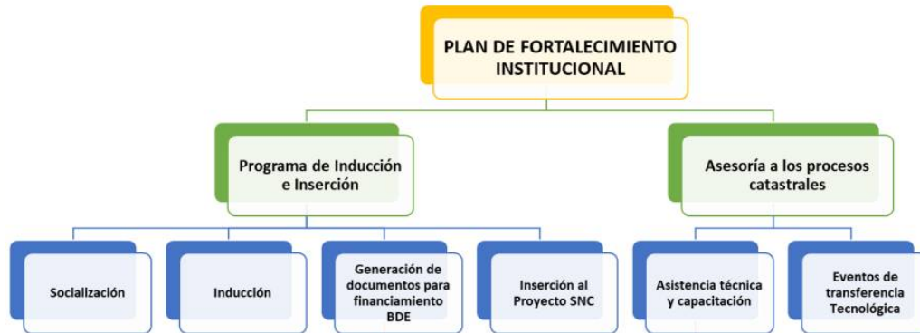
Figura 4: Plan de Fortalecimiento institucional