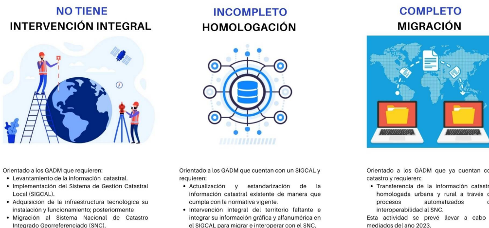
Figura 1: Niveles de intervención

Los niveles de intervención en los GADM a nivel nacional previstos para la ejecución son: