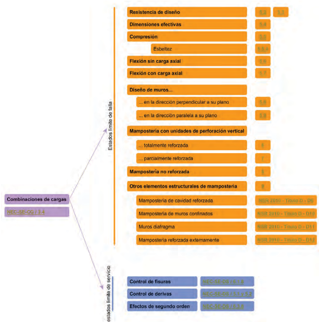
Figura 2: esquema conceptual de análisis de la NEC-SE-MP