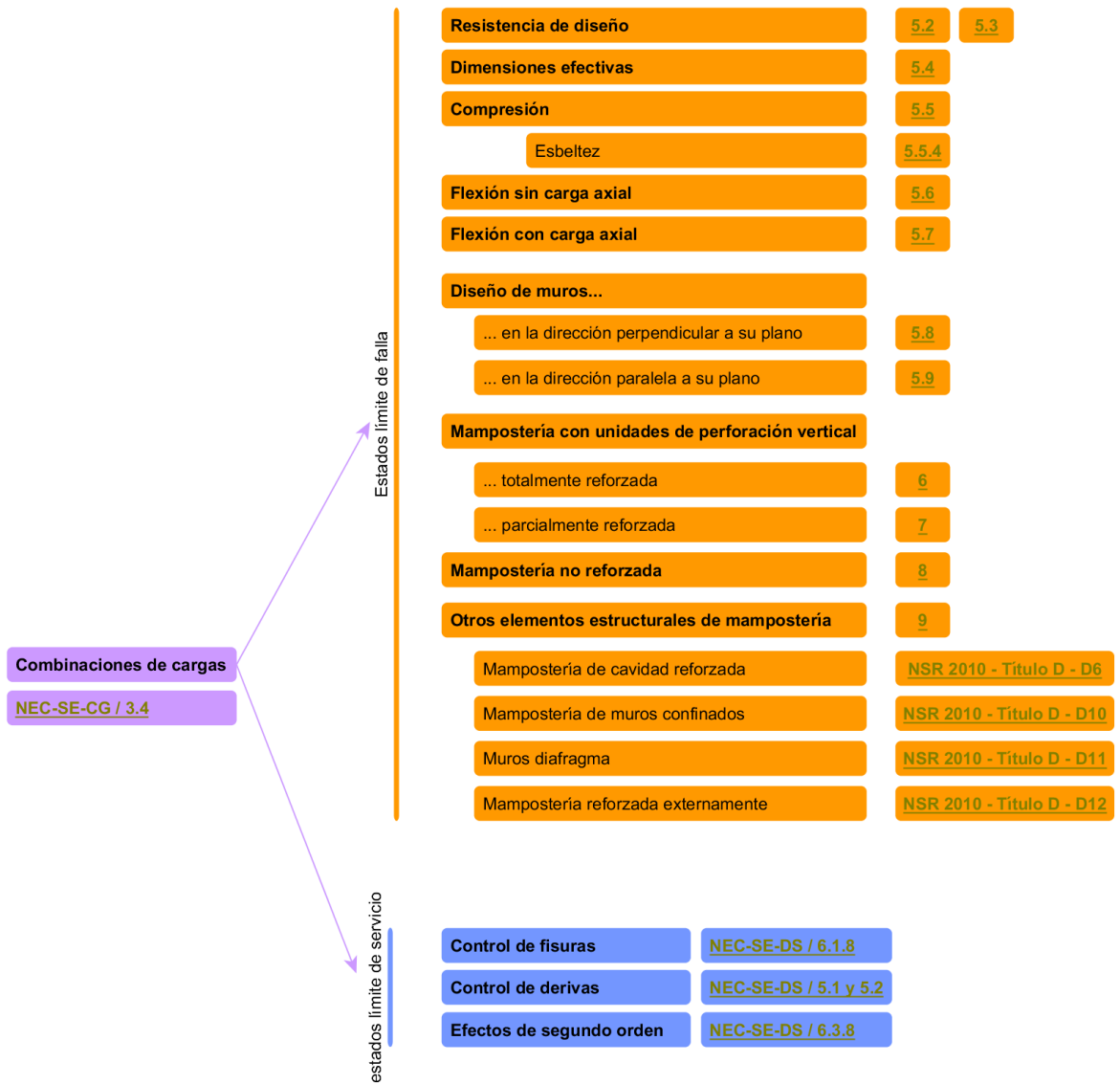
Figura 2: Esquema conceptual de análisis de la NEC-SE-MP