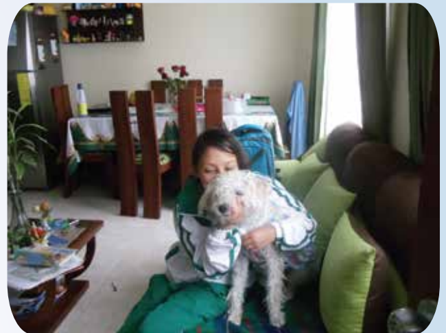
La alegría por disfrutar un nuevo hogar