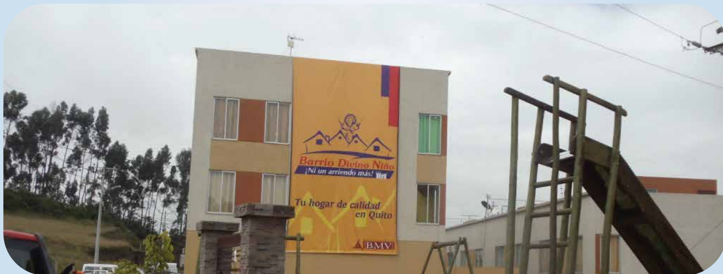
Conjunto Habitacional “Divino Niño”

Quito se divisa como una franja que se extiende a lo largo, las casas se ven pequeñas y entrelazadas entre grandes avenidas, mientras las montañas al fondo resguardan a la capital.