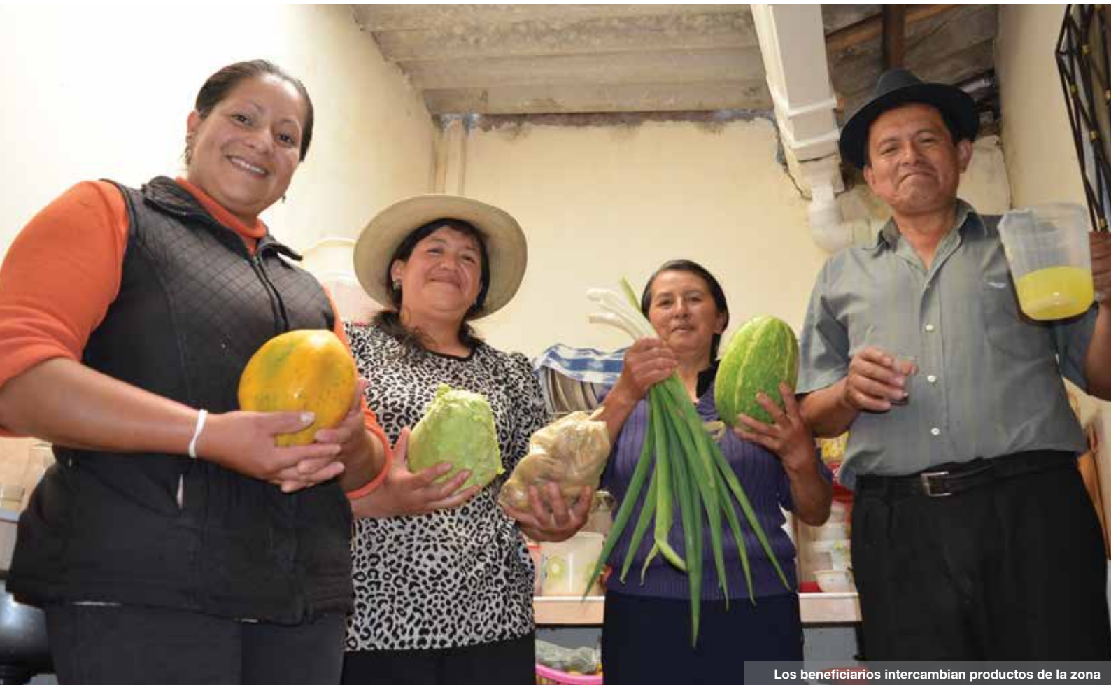
Los beneficiarios intercambian productos de la zona